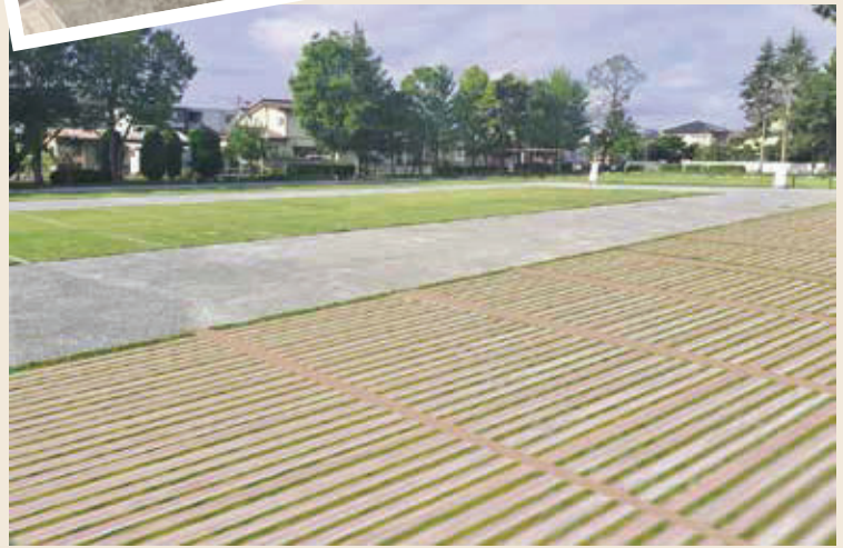
公共施設 イメージ図